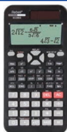
Tabela porównawcza REBELL SC2060S CASIO FX-85ES PLUS SHARP EL-W531TG TI TI-30XS MultiView